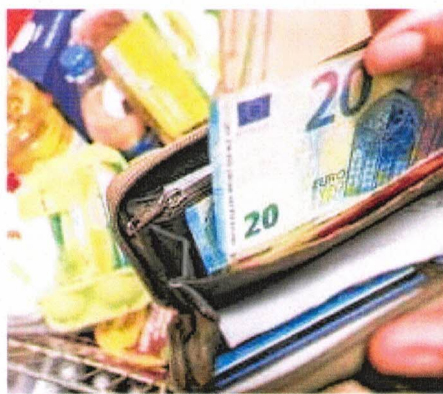
L'inflazione e l'aumento dei prezzi di tutti i prodotti, anche alimentari

È la principale e più urgente delle necessità di tutti i settori. Le previsioni parlano di ulteriori impennate dei prezzi