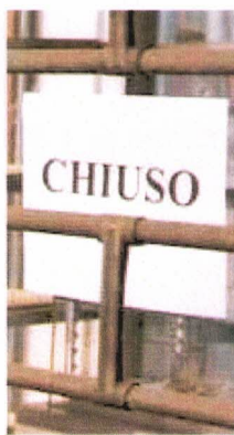
Un negozio chiuso a causa della crisi

Due temi cruciali e uniti in regione per cui si chiedono garanzie